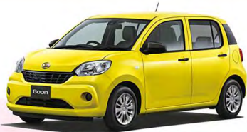
(ベース車:ブーンX" SA II" /CVT/1000cc)