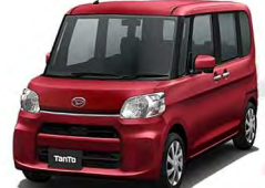
(ベース車:タントL" SA III" /CVT/660cc)