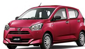
(ベース車:ミライースL" SA III" /CVT/660cc)