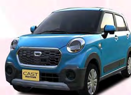
(ベース車:キャストアクティバX/CVT/660cc)

※4WD車は124,200円高、デザインフィルムトップ車は43,200円高となります。