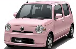
(ベース車:ミラココアL/CVT/660cc)