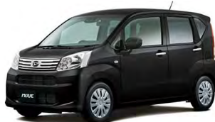
(ベース車:ムーヴL" SA III" /CVT/660cc)