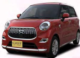
(ベース車:キャストスタイルX/CVT/660cc)