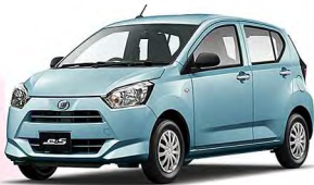
(ベース車:ミライースL/CVT/660cc)